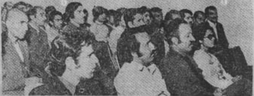
گوشه‌ای از اجتماع ایرانیان استان شیراز در کنفرانس حزب پان ایرانیست تشکیلات شیراز