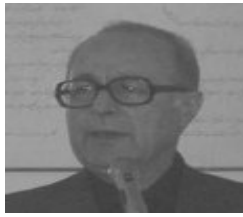
از: منوچهر یزدی

* جلال آل احمد: قبل از اسلام در ایران تمدنی نبود...!