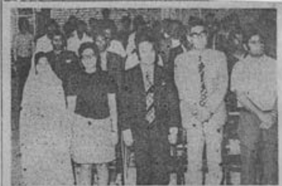
نوداری از باشندگان در کنفرانس باشکوه حزب پان ایرانیست تشکیلات بیبهان