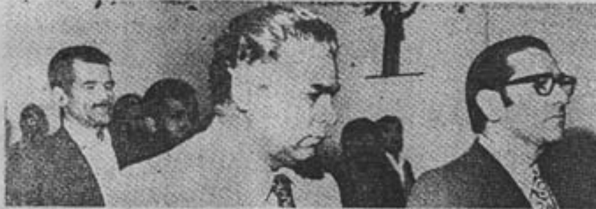
چند تن دیگر از باشندگان در نشست حزب پان ایرانیست تشکیلات شیراز