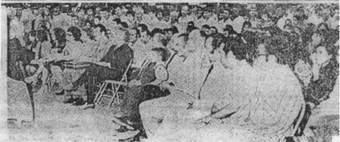
گوشه‌ای از اجتماع مردم آزاده خرمشهر در میتینگ شکوهمند حزب پان ایرانیست