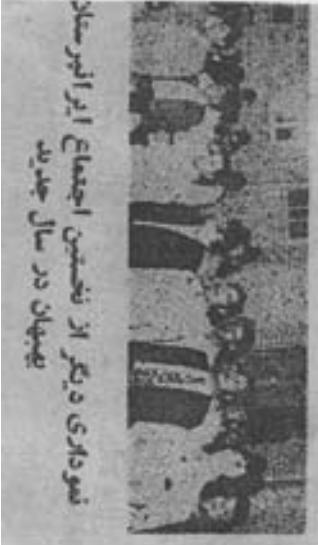
نوداری دیگر از نخستین اجتماع ایرانیستلار بیبهان در سال چهارم