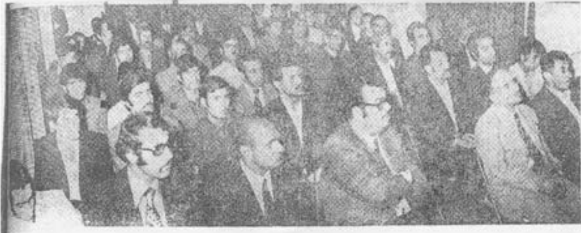
گوشه ای از کنفرانس کارگری حزب پان ایرانیست که در باشگاه مرکزی حزب برگزار گردید