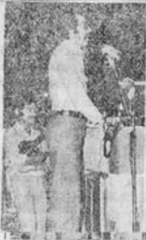
سرور عزیز سالی کوشنده سنگر از پانلی حزب پان ایرانیست که مدیریت میتینگ بزرگ خرمشهر را به عهده داشتند