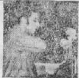
سرور کارزونی نژاد کوشنده سنگر استوار خرمشهر بهنگام صلای نیایش حزبی